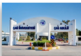
Universidad de Cag